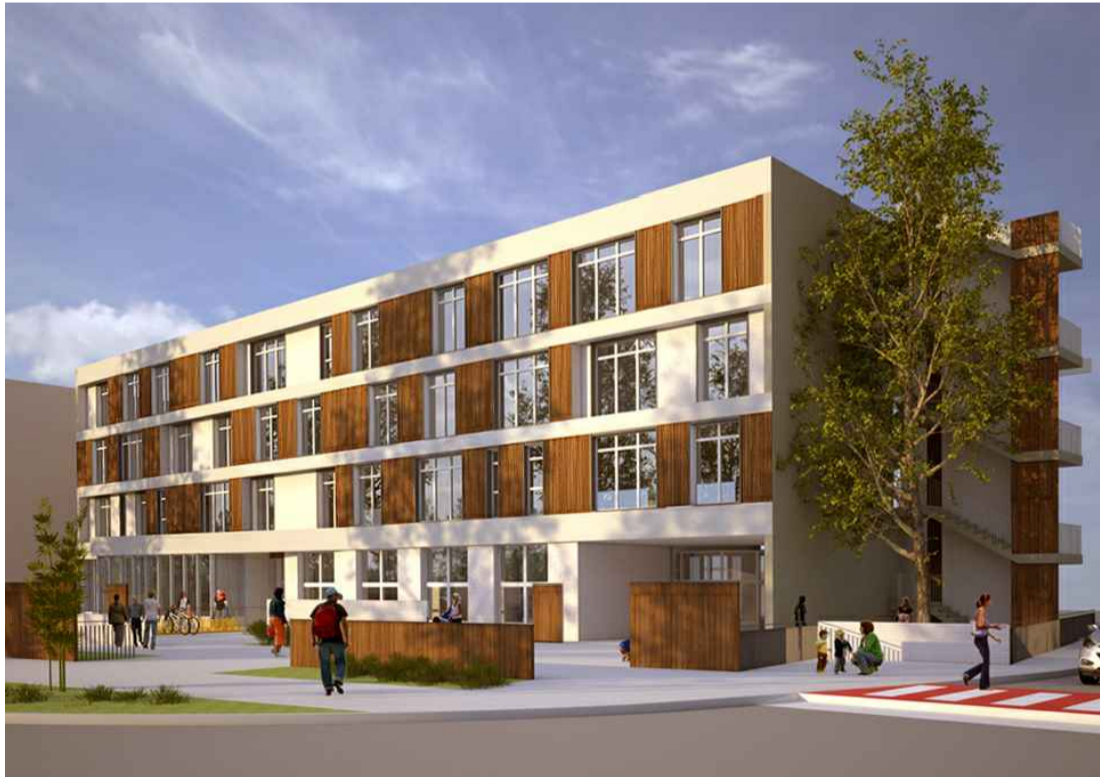
RISTRUTTURAZIONE DELLA PALAZZINA DA ADIBIRE A DELEGAZIONE COMUNALE E UFFICI POLIZIA MUNICIPALE Ferrara - Via Tassoni